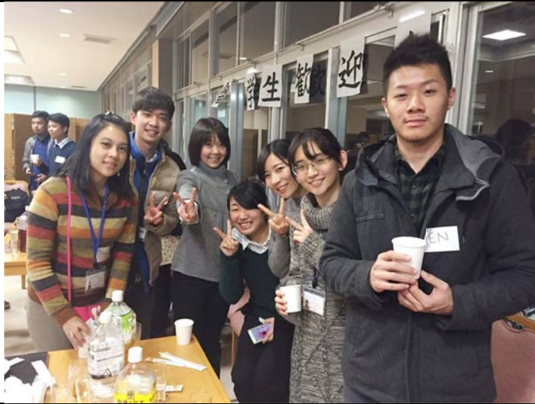
■ Welcome party 與日本學生合影