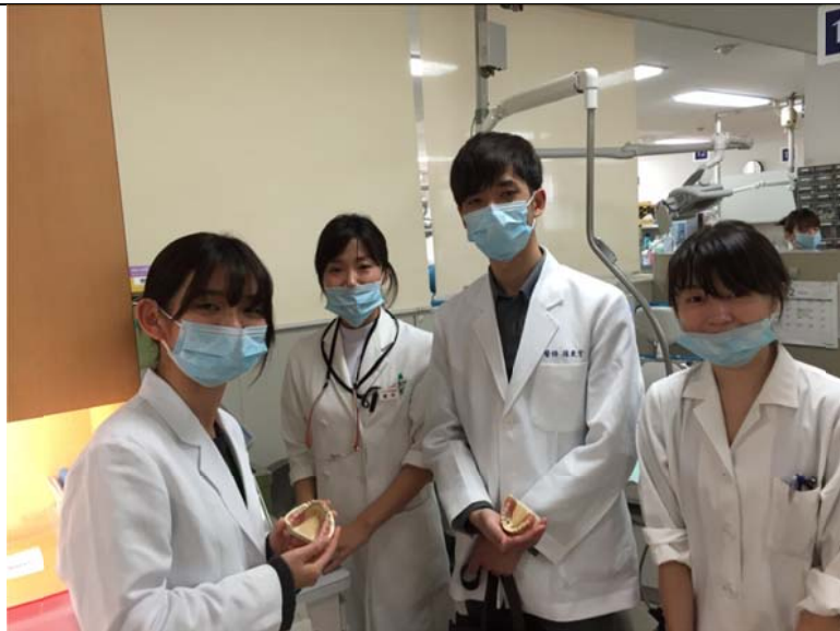
■ 齒科診間見習-義齒補綴科