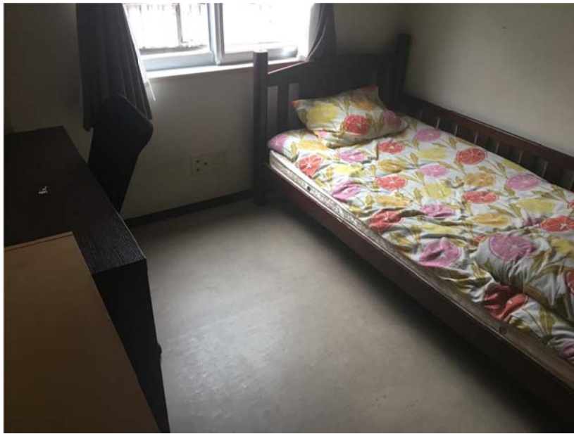
<圖二：這一個月住的房間，房租 81000 日元>