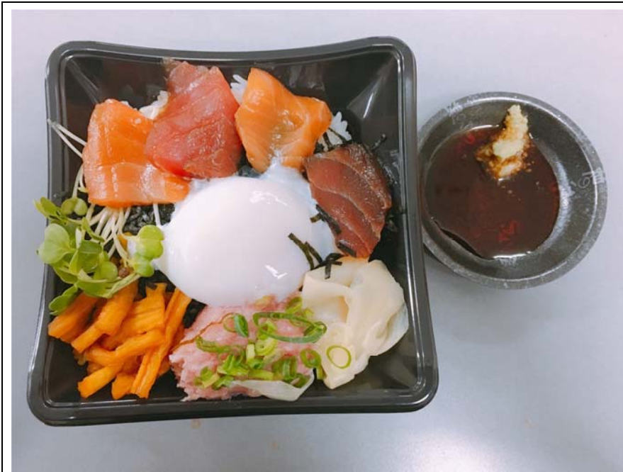
<圖六：第一天至急診科部請的海鮮丼飯>