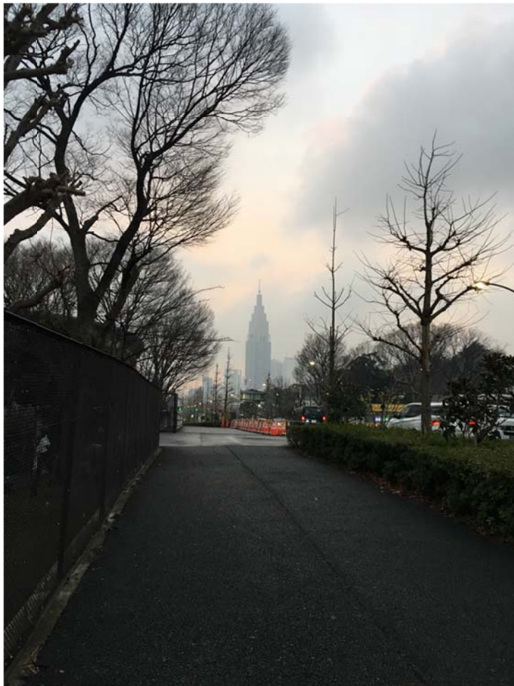
<圖三：每日從租屋處步行至慶應病院的必經之途，遠方是 docomo tower>