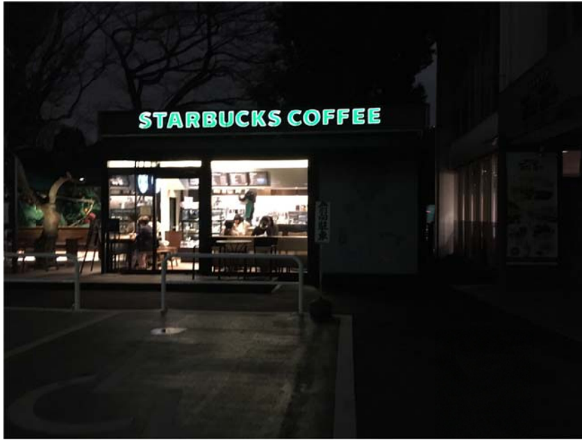
<圖八：有一次看 cranioplasty 手術到晚上七點，出來天已經黑了>