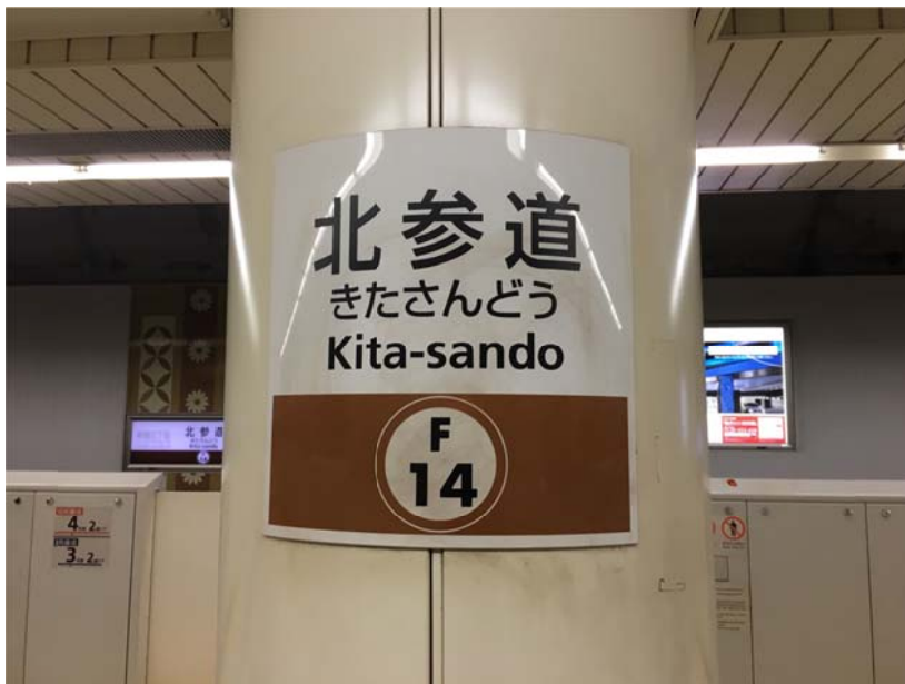
<圖一：這一個月住在北參道地鐵站附近的 Sakura house>