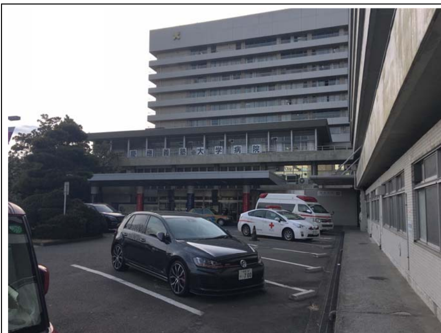
<圖四：慶應病院外觀，招牌下面是大門口，右邊走道走到底再右轉即可抵達急診>