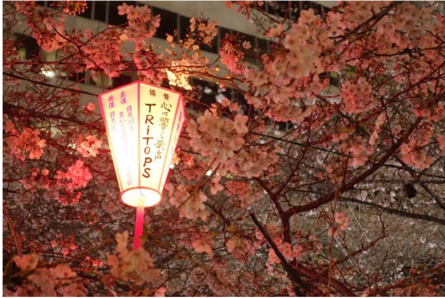
<圖十七：自選期間適逢日本櫻花季，圖為目黑川夜櫻>