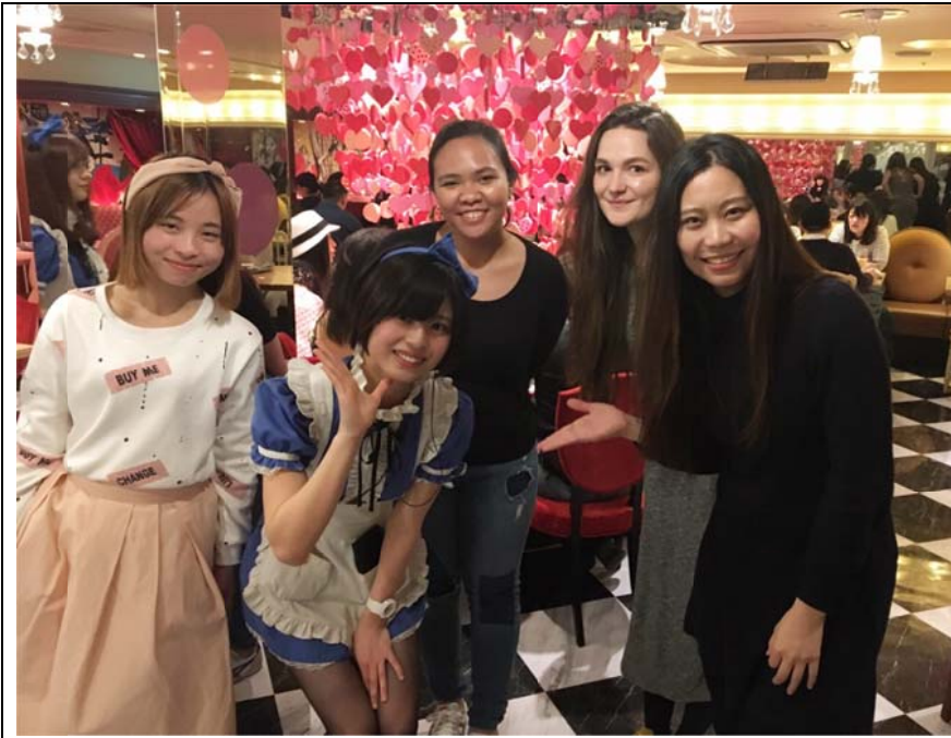
<圖十五：與 sakura house 的室友們聚餐>