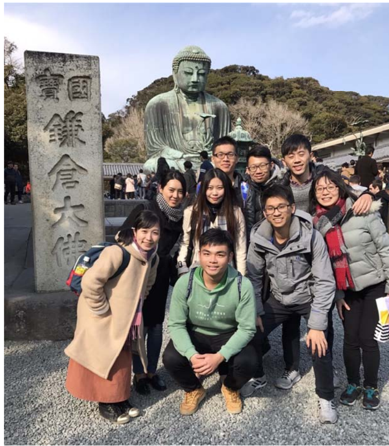
<圖十三：利用週末與 1001 同學以及之前來北醫短期交換的日本學生，一起去鎌倉旅游>