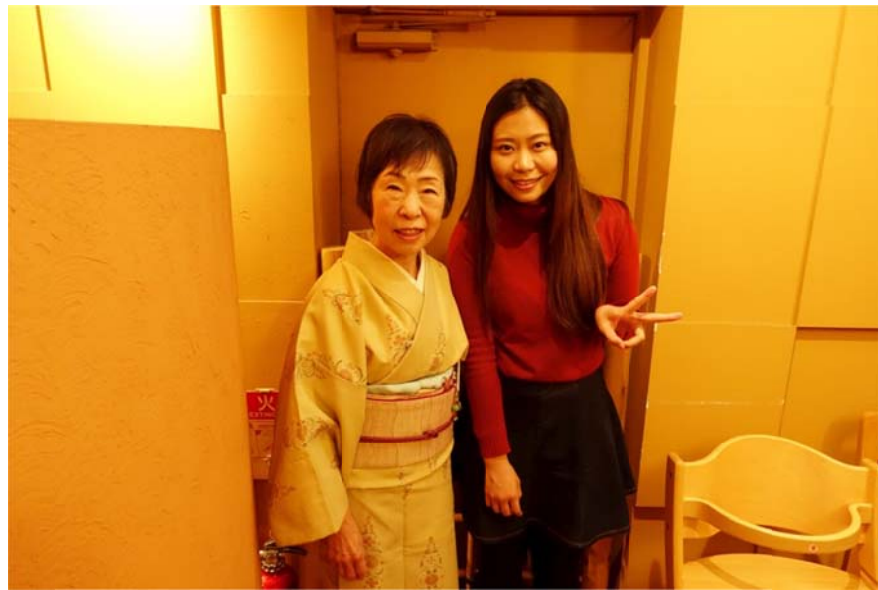
<圖十六：六本木某涮涮鍋餐廳的服務生熱情邀我合影>