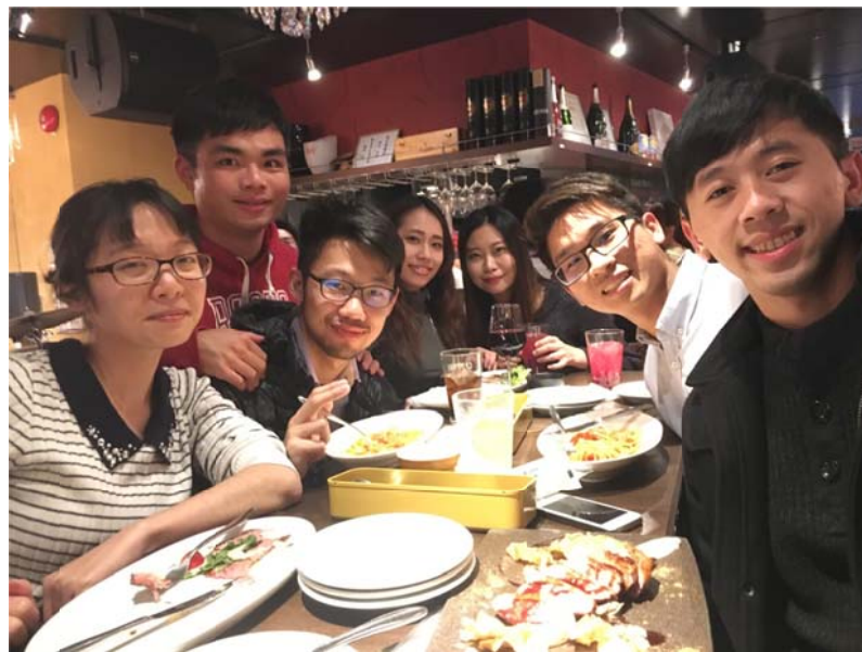
<圖十四：自選期間某天恰好是我生日，與 1001 同學一起慶生>