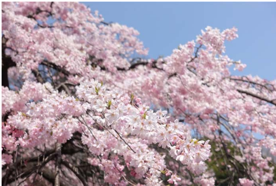
<圖十八：慶應附近新宿御苑的美麗櫻花>