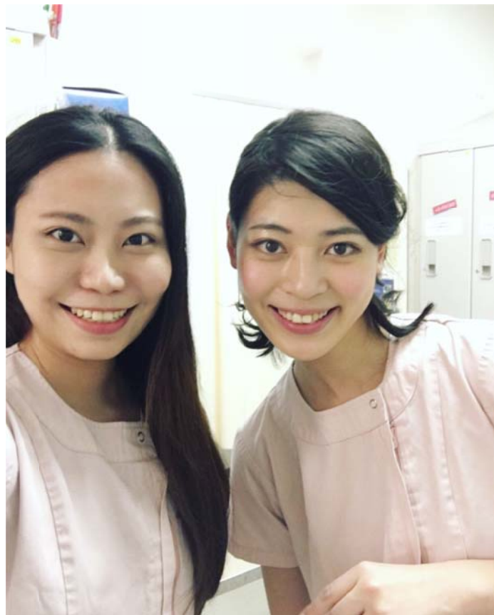
<圖七：帶我一起進手術房看燙傷病患 debridement 的光畑同學>