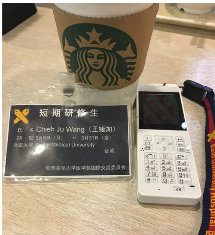
<圖五：慶應發放的識別證以及公務機>