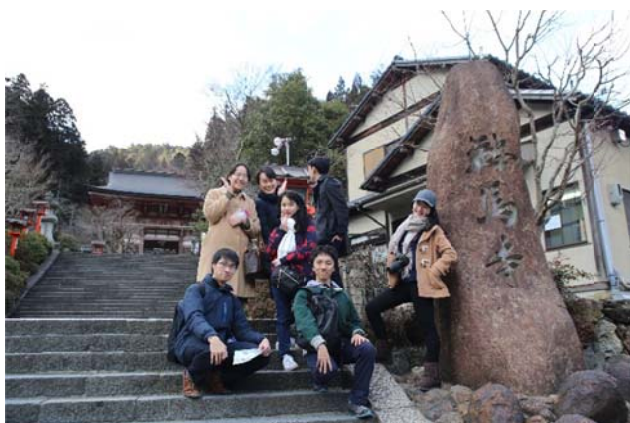
與日本大阪大學醫學生和外國學生出遊(京都鞍馬寺)

*** word 檔格式至少三頁，中文字體標楷體 12 級字；英文字體 Arial12 級字。 務必回傳電子檔 。)**