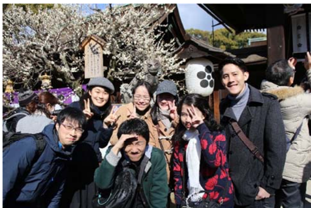
與日本大阪大學醫學生和外國學生出遊(京都北野天滿宮)