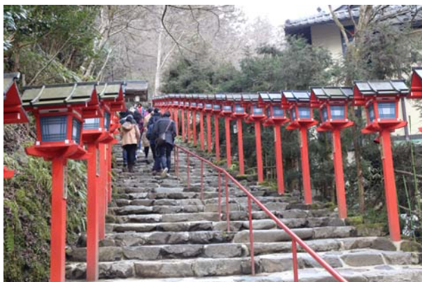
與日本大阪大學醫學生和外國學生出遊(京都貴船神社)