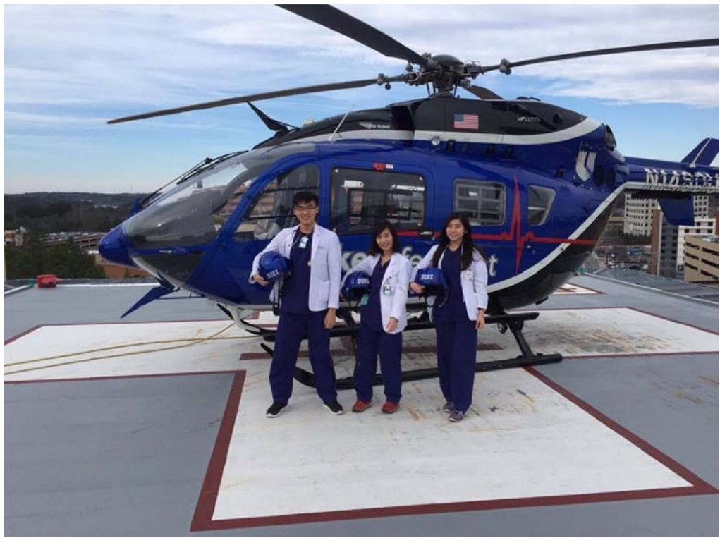
參觀 Duke Medical Center 的直升機