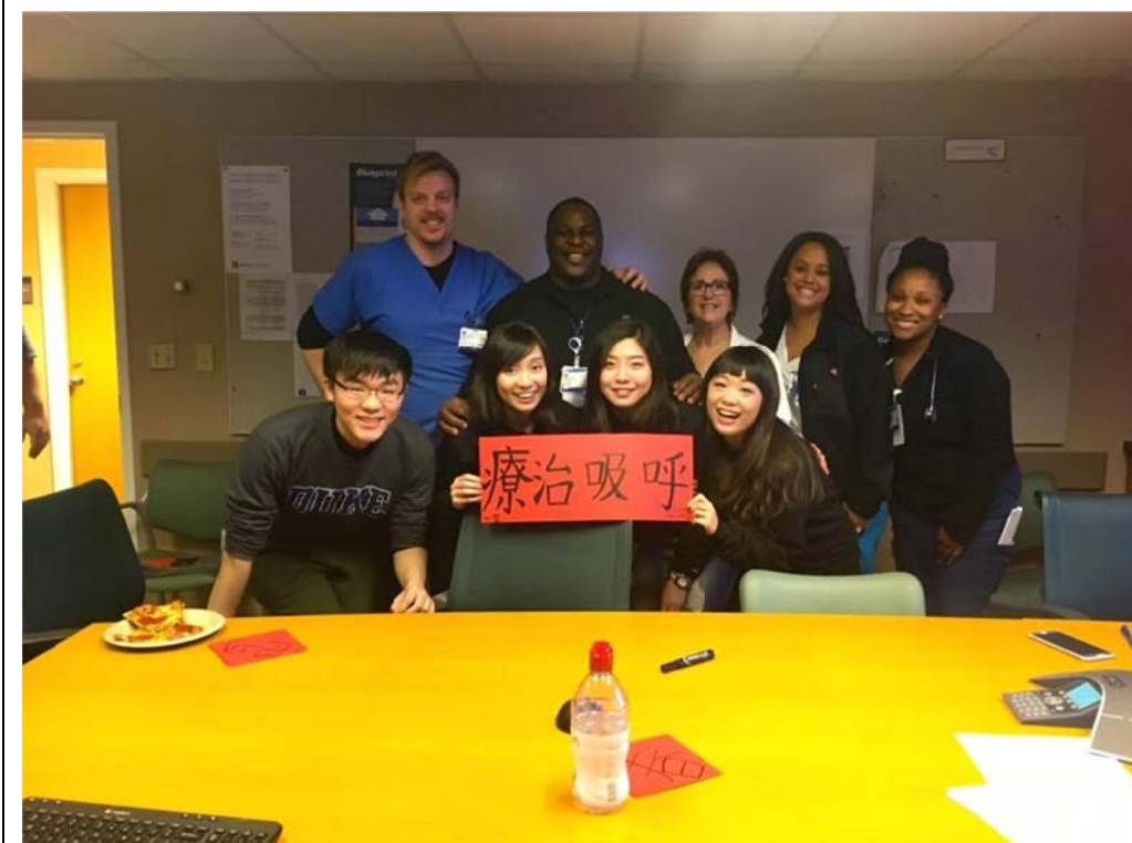
最後一天我們送呼吸治療的春聯當做卡片

*** word 檔格式至少三頁，中文字體標楷體 12 級字；英文字體 Arial12 級字。 務必回傳電子檔 。)* **