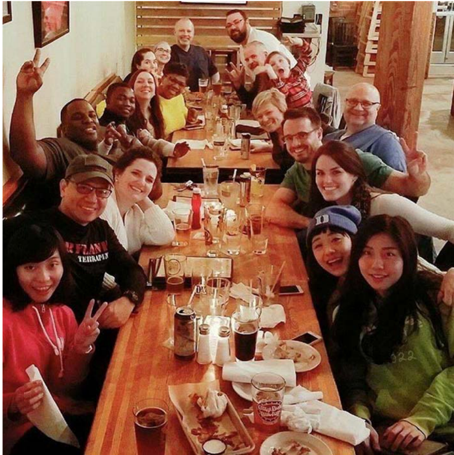
和 RT 歡樂聚餐