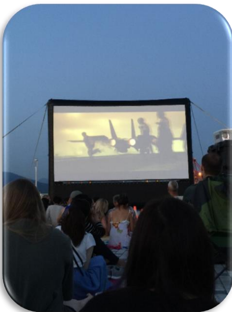
Outside movie night