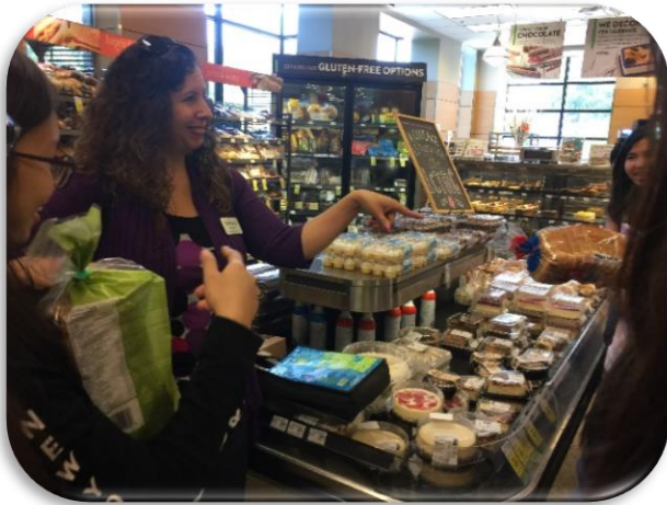
參觀超市 認識食物