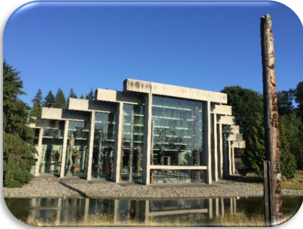
Museum of Authority